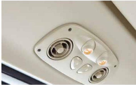
Cửa gió điều hòa và đèn hành khách