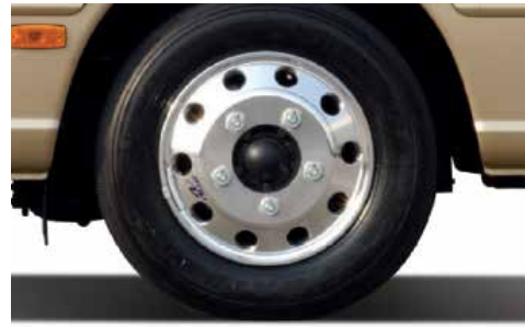
Mâm xe 16', thép cao cấp