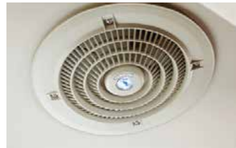
Quạt thông gió khoang hành khách, mang lại không khí dễ chịu, thoải mái