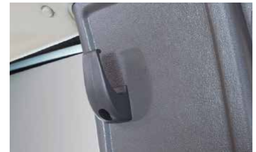
Móc đồ tiện lợi