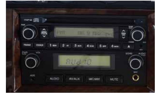
Hệ thống giải trí hiện đại