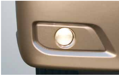
Đèn sương mù thiết kế mới, tăng độ chiếu sáng.