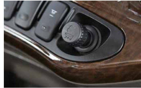
Đầu châm thuốc