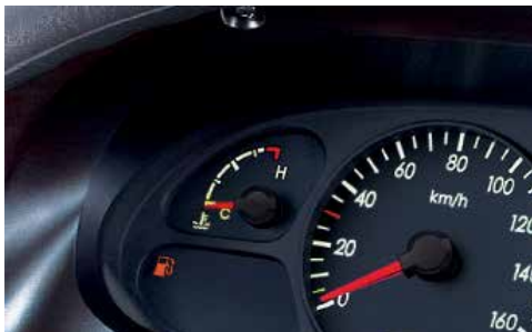
Đồng hồ tốc độ và báo xăng hiện đại