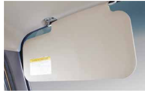
Tấm chắn nắng