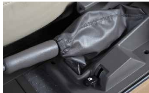
Phanh tay cạnh ghế lái, thuận tiện cho người sử dụng.