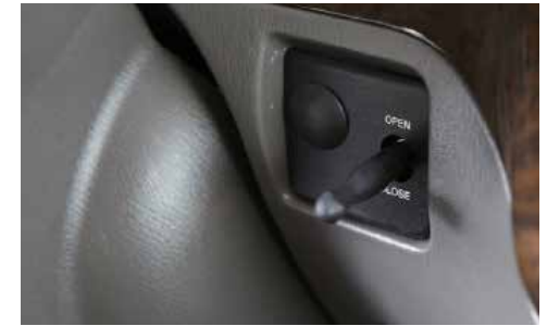
Công tắc cửa khoang hành khách