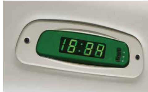
Đồng hồ điện tử khoang hành khách