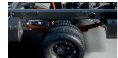
Tải trọng cầu cao và nhíp sau cứng cáp