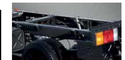
Khung sắt xi bằng thép cao cấp, cứng cáp