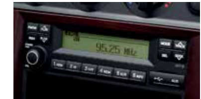
Hệ thống âm thanh đa đủ kết nối: USB, AUX, Bluetooth