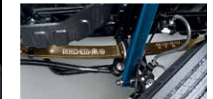
Tăng cường hệ thống treo và giảm chấn trước