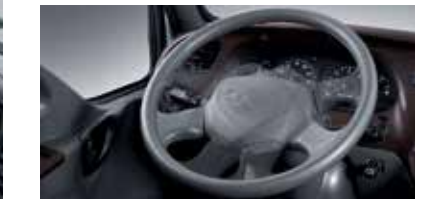
Vô lăng gạt gù và trợ lực