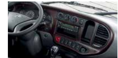
Bảng điều khiển trung tâm hiện đại và dễ thao tác