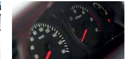
Cụm đồng hồ trung tâm hiển thị rõ ràng, nổi bật