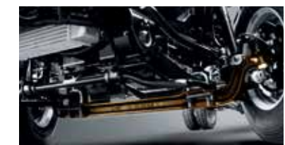
Thanh giằng cầu giúp ổn định và an toàn khi lái xe